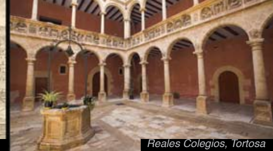
Reales Colegios, Tortosa