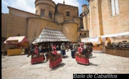
Baile de Caballitos