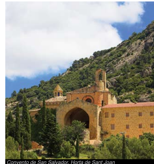
Convento de San Salvador, Horta de Sant Joan

Sin duda alguna, uno de los personajes más célebres que se hallan vinculados al territorio fue el pintor Pablo Picasso . Sus breves pero intensas estancias en Horta de Sant Joan, en la Terra Alta, marcaron el inicio del cubismo y se convirtieron en un punto y aparte en el desarrollo de las vanguardias pictóricas del siglo XX.