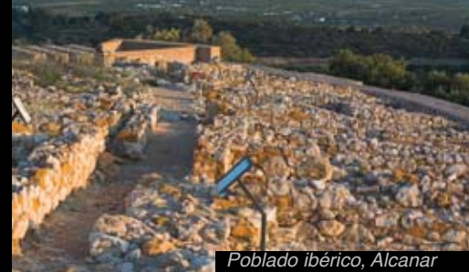
Poblado ibérico, Alcanar

> El conjunto más importante de Cataluña