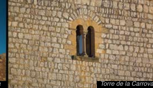
Torre de la Carrova