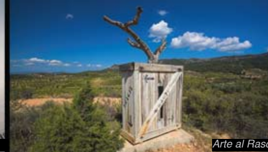
Arte al Raso