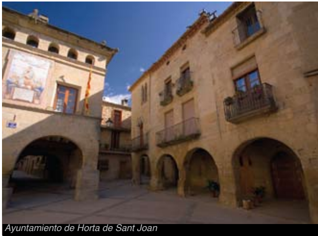
Ayuntamiento de Horta de Sant Joan

>El Casco Antiguo de Horta de Sant Joan. El casco antiguo del pueblo conserva su carácter medieval con calles estrechas; por ello, no debéis visitar el núcleo con vehículo, u os perderéis la mirada de un pueblo encantador. En los alrededores de la plaza del Ayuntamiento tenéis dos lugares perfectos para hacer un descanso. El conjunto arquitectónico de Horta, que está declarado Bien Cultural de Interés Nacional, aporta la plaza porticada de la Iglesia gótica, el Ayuntamiento renacentista y las calles que lo rodean, donde localizaréis enseguida las viviendas monumentales construidas en el siglo XVI. La prisión está en los bajos del Ayuntamiento, donde se encuentra la exposición que explica la evolución urbana de Orta. La Casa de la Comanda o Delme es un palacio renacentista del siglo XVI-XVII, donde antiguamente residía el comendador de la orden del Hospital.