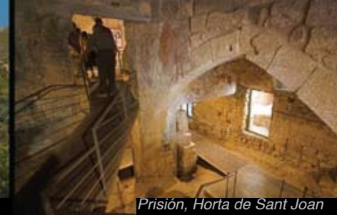
Prisión, Horta de Sant Joan

En las Terres de l'Ebre podemos encontrar otros núcleos de gran belleza, como los barrios medievales de Batea, Arnes, Horta de Sant Joan o Tivissa, o de origen árabe como el casco antiguo de Miravet, entre otros.