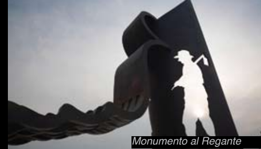
Monumento al Regante