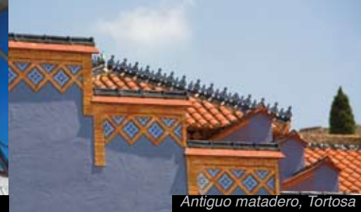
Antiquo matadero, Tortosa