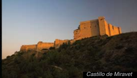
Castillo de Miravet