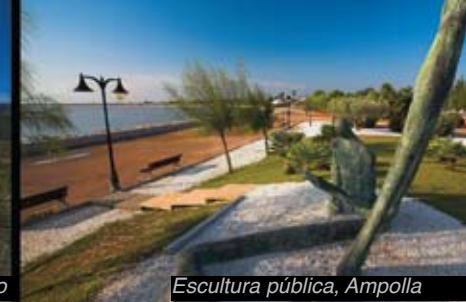
Escultura pública, Ampolla