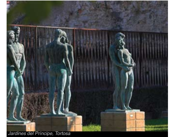
Jardines del Príncipe, Tortosa