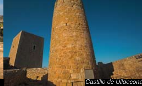
Castillo de Ulldacona