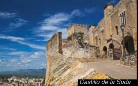
Castillo de la Suda