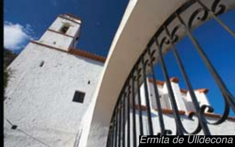
Ermita de Ulldecona