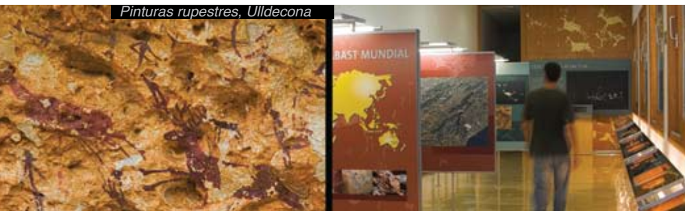
Pinturas rupestres, Ulldecona

> Los iberos del Valle del Ebro se denominaban ilerconvones y buscaban puntos estratégicos para instalarse.