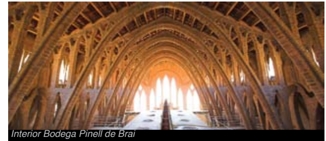
Interior Bodega Pinell de Brai

> El modernismo en las Terres de l'Ebre. La bodega cooperativa de Pinell de Brai, conocida como La Catedral del Vino, es la obra maestra del arquitecto Cèsar Martinell i Brunet, discípulo de Gaudí. De estilo novecentista, destaca por su fachada con decoraciones cerámicas pintadas y el juego de arcadas interiores obradas con ladrillos.