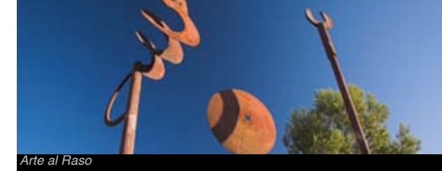
Arte al Raso

En el Centro lúdico Tosses XXI de Amposta, hay diversas obras de arte de gran formato que os permitirán contemplar esculturas y pinturas en vuestro tiempo de ocio.