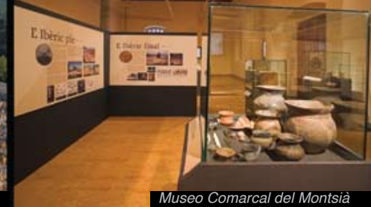
Museo Comarcal del Montsià