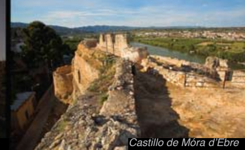
Castillo de Móra d'Ebre