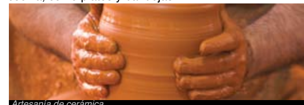
Artesanía de cerámica

En Miravet, Tivenys y la Galera se produce la cerámica. La producción de cerámica es una actividad artesanal de origen ibérico y musulmán muy arraigada en algunas poblaciones de las Terres de l'Ebre como Miravet en la Ribera d'Ebre, Tivenys en el Baix Ebre o La Galera en el Montsià. Se hacen cántaros, lebrillos, jarras y utensilios de cocina, como platos y bandejas.