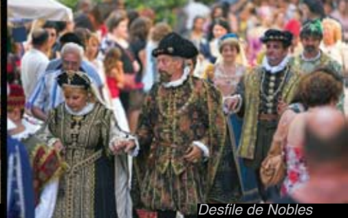
Desfile de Nobles