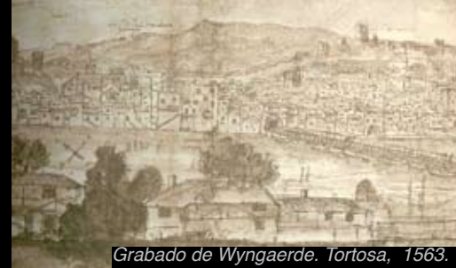
Grabado de Wyngaerde. Tortosa, 1563.