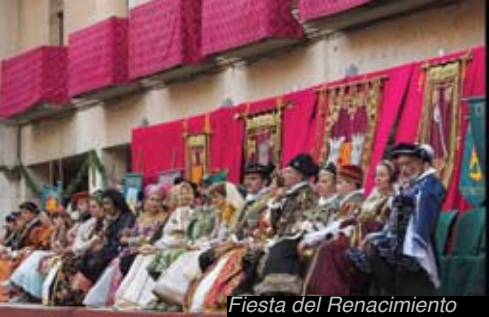
Fiesta del Renacimiento