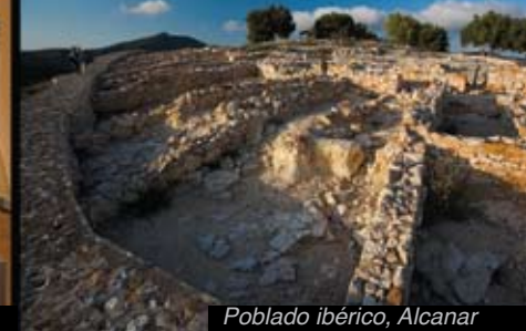
Poblado ibérico, Alcanar

El arte rupestre del arco mediterráneo de la península Ibérica está muy bien representado en las Terres de l'Ebre.