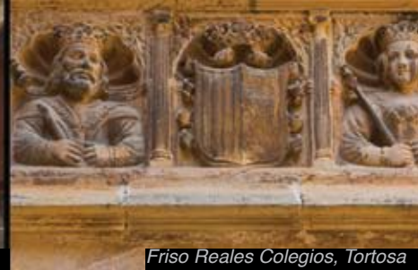
Friso Reales Colegios, Tortosa

> Catedral de Santa María de Tortosa. La desaparecida seo románica estaba situada en el mismo recinto. Las obras de la catedral gótica se inician en el siglo XIV y se alargan hasta la mitad del siglo XVIII.