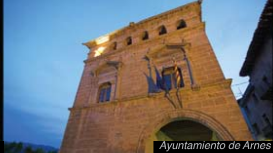
Ayuntamiento de Arnes