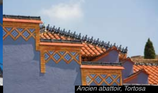
Ancien abbattoir, Tortosa