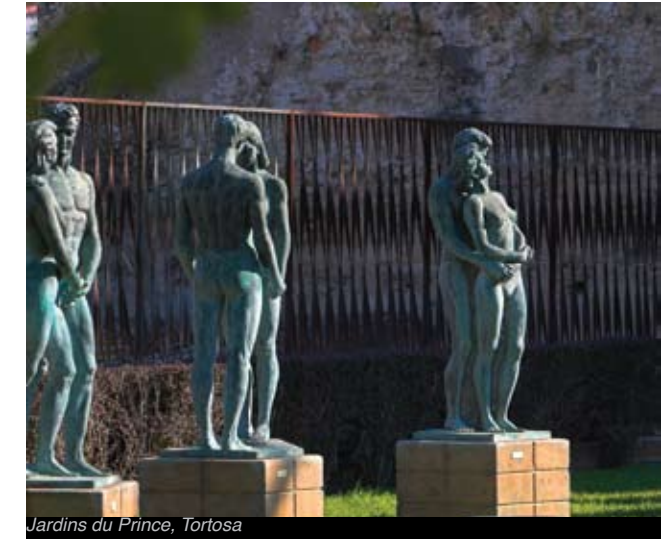
Jardins du Prince, Tortosa

Dans les jardins qui s'étendent du Château de la Suda au Fortin de Tenasses, en longeant la muraille édifiée par la ville au XIVe siècle, promenez-vous au cœur d'une exposition permanente en plein air et laissez-vous séduire par les œuvres du sculpteur Santiago de Santiago.