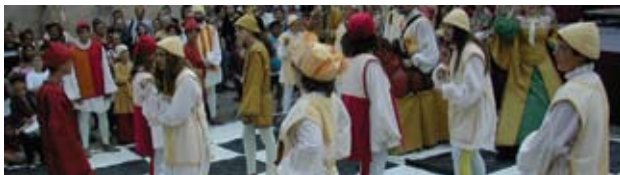
Petits et grands au rendez-vous de l'Échiquier vivant

Móra d'Ebre revit son passé sous domination arabe, une période lors de laquelle vivaient en bonne entente, musulmans, juifs et chrétiens. Le temps d'un week-end de la première quinzaine de juillet, bouffons et gastronomie arabe déploient leur imagination, le marché artisanal présente ses vieux métiers où se retrouvent forgerons, fileuses, boulangers et tailleurs de pierre tandis que les spectacles de musique, de danse et de théâtre se succèdent pour que Móra redevienne Maure, brandissant haut de nouveau, et le temps d'un week-end seulement, sa croix et son croissant de lune.