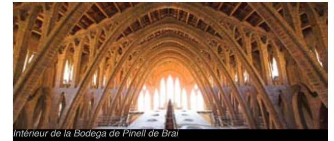
Intérieur de la Bodega de Pinell de Brai