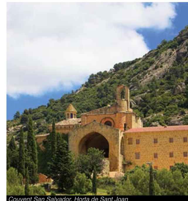
Couvent San Salvador, Horta de Sant Joan

Mais l'une des personnalités les plus célèbres liées à ce territoire est-elle, sans aucun doute, le peintre Pablo Picasso . Ses brefs mais intenses séjours à Horta de Sant Joan, en Terra Alta ont en effet marqué le début du cubisme et ont donné lieu à un avant et un après dans le développement des avant-gardes picturales du XXe siècle.