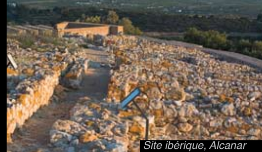
Site ibérique, Alcanar