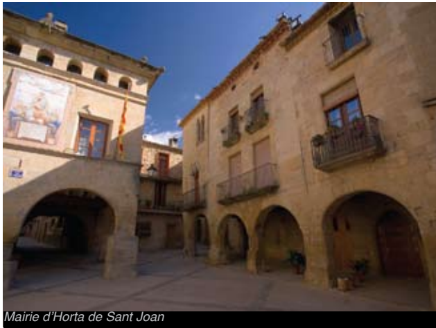
Mairie d'Horta de Sant Joan