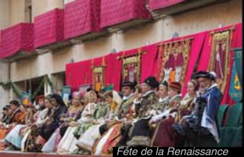
Fête de la Renaissance