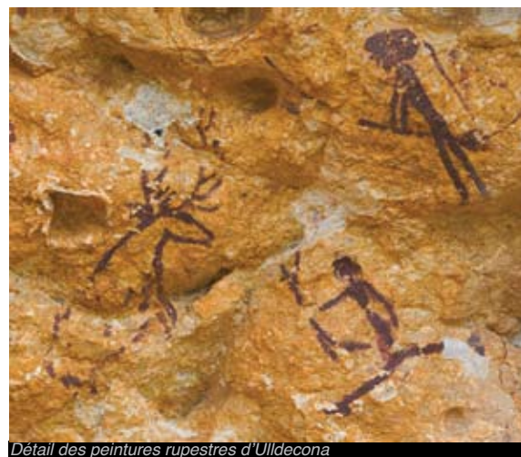
Détail des peintures rupestres d'Uildecona

Découvrez toute la symbolique des figures humaines et animales des vestiges de l'art rupestre des Terres de l'Ebre, déclarés Patrimoine de l'Humanité