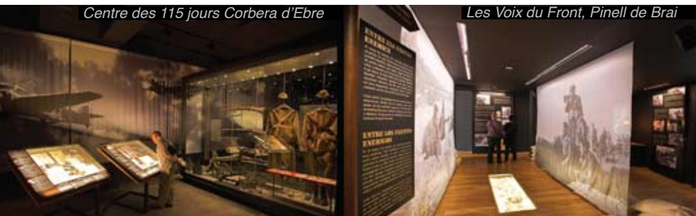
Les Voix du Front, Pinell de Brai