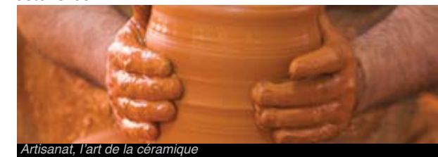
Artisanat, l'art de la céramique

En Miravet, Tivenys et la Galera l'on fabrique des objets en céramique. La production de céramique est une activité artisanale d'origine ibérique et musulmane très enracinée dans certains villages des Terres de l'Ebre, tels que Miravet , en Ribera d'Ebre, Tivenys dans le Baix Ebre, ou encore La Galera , dans le Montsià. L'on y fabrique des brocs, des cruches, des cuvettes, des jarres ainsi que des ustensiles