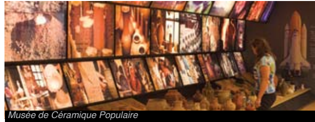
Musée de Céramique Populaire

Dans ce même musée vous serez également proposés des services touristiques complets ainsi que de magnifiques itinéraires regorgeant de savoirs divers.