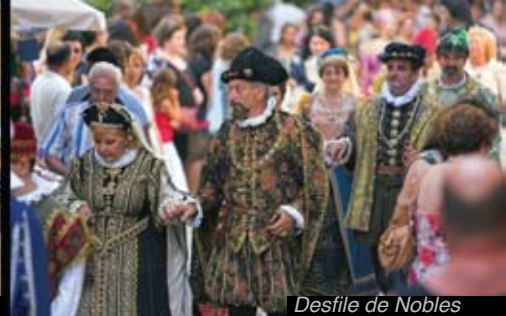
Desfile de Nobles