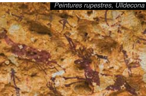
Peintures rupestres, Uildecona

> Les ibères de la Vallée de l'Ebre s'appelaient les ilercavons et recherchaient des lieux stratégiques où s'installer.