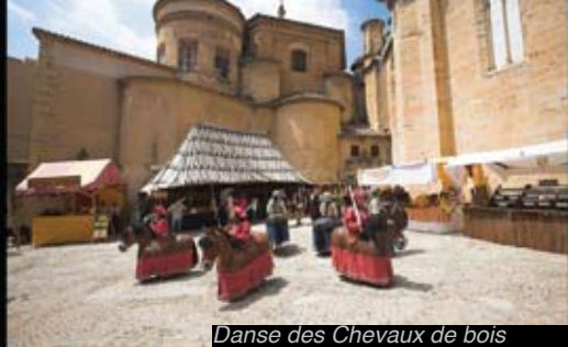
Danse des Chevaux de bois