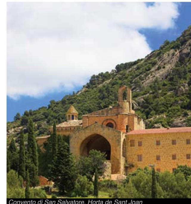
Convento di San Salvatore, Horta de Sant Joan

Senza dubbi uno dei personaggi più celebri vincolati al territorio fu il pittore Pablo Picasso . I suoi soggiorni intensi benché brevi ad Horta de Sant Joan, nella Terra Alta, segnarono l'inizio del cubismo e divennero un punto e a capo nello sviluppo delle avanguardie pittoriche del XX secolo.