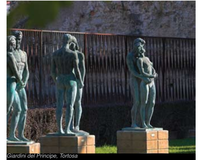
Giardini del Principe, Tortosa