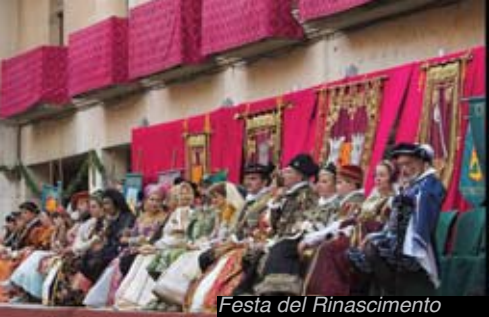
Festa del Rinascimento