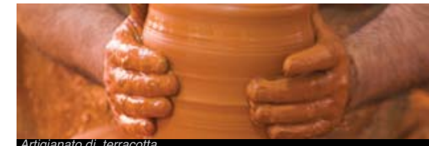
Artigianato di terracotta

A Miravet, Tivenys e la Galera vi si produce terracotta . La produzione di terracotta è un'attività artigianale d'origine iberica e musulmana molto attecchita in alcune località delle Terres de l'Ebre come Miravet , nella Ribera d'Ebre, Tivenys , nel Baix Ebre, o La Galera , nel Montsià. Si fanno brocche, catini, giare e utensili da cucina, come piatti e vassoi.