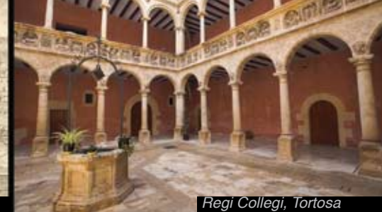
Regi Collegi, Tortosa