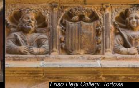
Friso Regi Collegi, Tortosa

> Cattedrale di Santa Maria di Tortosa. Lo scomparso duomo romanico era situato nello stesso recinto. I lavori della cattedrale gotica iniziano nel secolo XIV e si allungano fino alla metà del secolo XVIII.