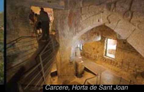
Carcere, Horta de Sant Joan

Nelle Terres de l'Ebre possiamo trovare altri nuclei di grande bellezza, quali i quartieri medioevali di Batea, Arnes, Horta de Sant Joan o Tivissa, o quelli d'origine araba, come la borgata vecchia di Miravet, tra altri.