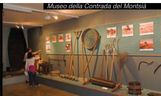
Museo della Contrada del Montsià