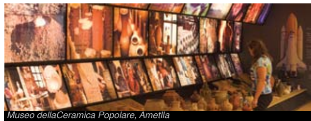
Museo della Ceramica Popolare, Ametlla

Nello stesso museo vi saranno offerti servizi turistici completi e itinerari magnifici che vi colmeranno di conoscenza.