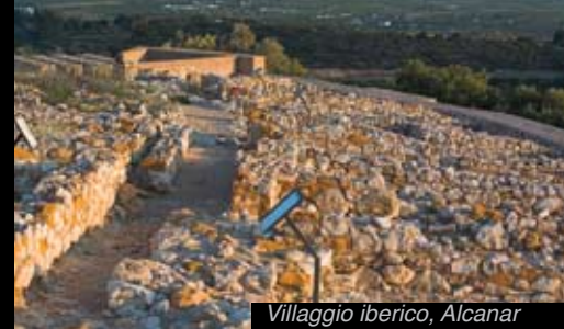
Villaggio iberico, Alcanar