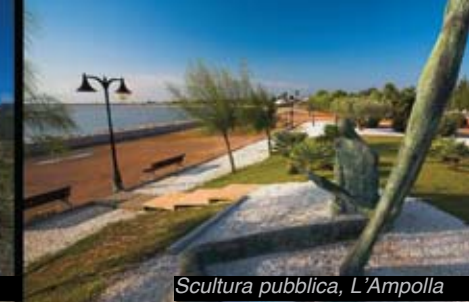
Scultura pubblica, L'Ampolla