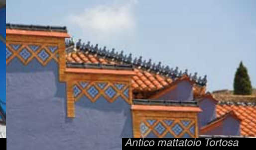
Antico mattatoio Tortosa