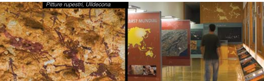
Pitture rupestri, Ulldecona

Cercate tutta la simbologia delle Figure umane e di animali dei giacimenti dell'arte rupestre dell'Ebre, patrimonio dell'Umanità