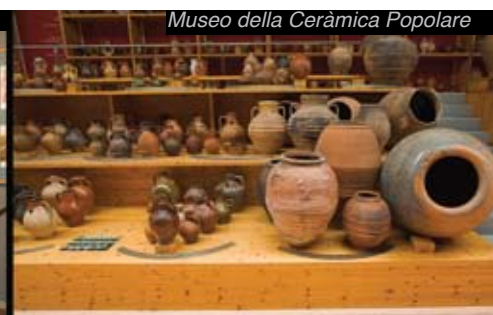
Museo della Ceramica Popolare