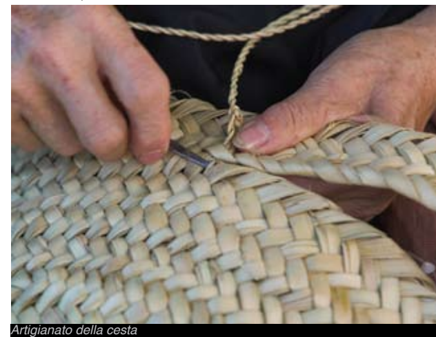
Artigianato della cesta