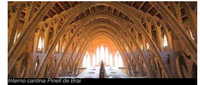
Interno cantina Pinell de Brai

La cantina cooperativa di Pinell de Brai conosciuta come La Cattedrale del Vino , è il capolavoro dell'architetto Cèsar Martinell i Brunet –discepolo di Gaudi-. Di stile noucentista spicca per la sua facciata con decorazioni ceramiche verniciate e l'insieme di arcate interne di mattone.