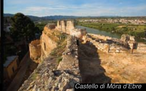
Castello di Móra d'Ebre