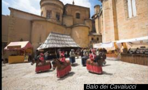
Balo dei Cavalucci