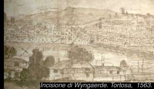
Incisione di Wyngaerde. Tortosa, 1563.