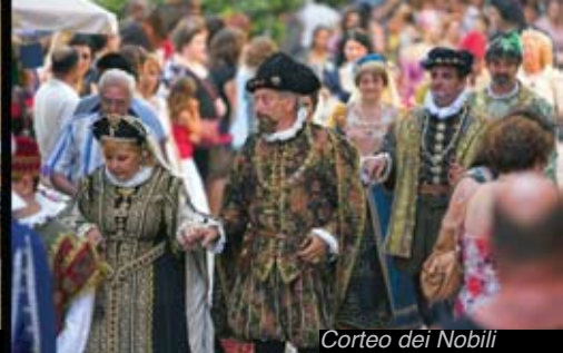
Corteo dei Nobili