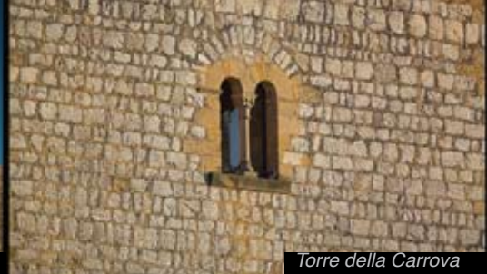
Torre della Carrova