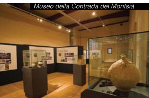
Museo della Contrada del Montsià

Osservatorio dell'Ebre, a Roquetes. Fondato nel 1904 dai gesuiti, è pioniere su scala mondiale nello studio dell'attività solare, e dispone anche d'una collezione di apparecchi scientifici.