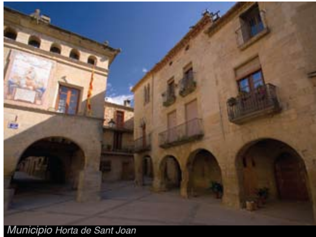
Municipio Horta de Sant Joan