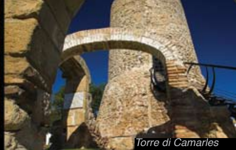
Torre di Camarles

Nelle Terres de l'Ebre troverete ispirazione durante le visite agli oltre venti castelli, tra cui spiccano per la loro situazione strategica, per la loro storia documentata, per le loro dimensioni e per le recenti ristrutturazioni ed ottima conservazione quello della Suda, a Tortosa, quello di Miravet, quello d'Ulldecona e quello di Móra d'Ebre.