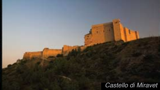
Castello di Miravet