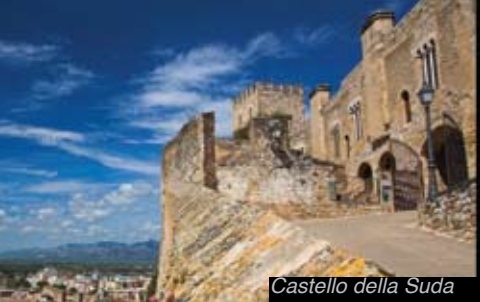
Castello della Suda